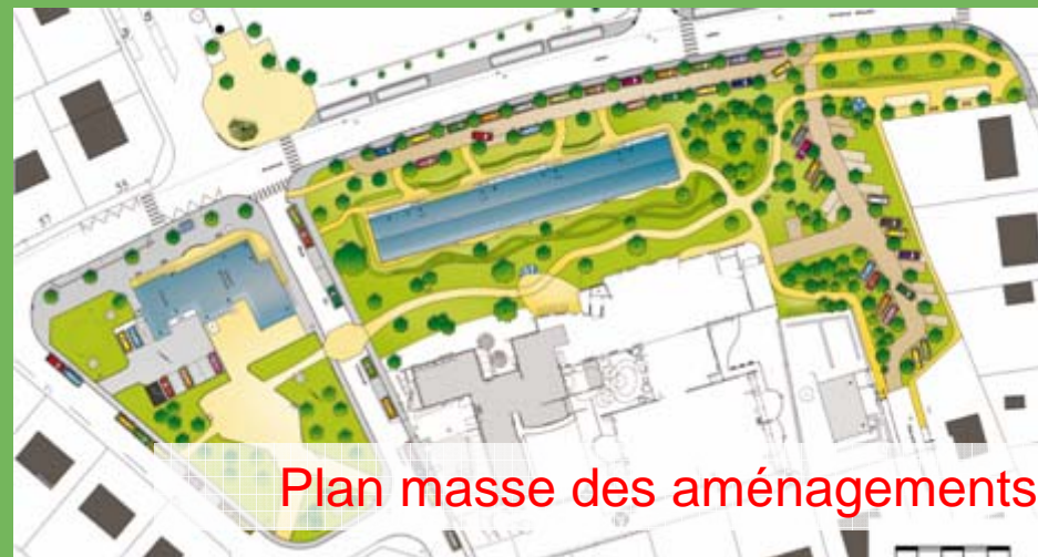
Plan masse des aménagements