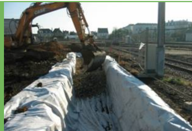
Réalisation des tranchées