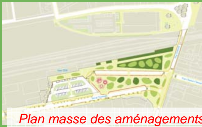
Plan masse des aménagements