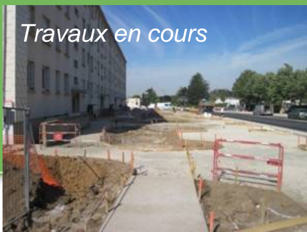
Travaux en cours