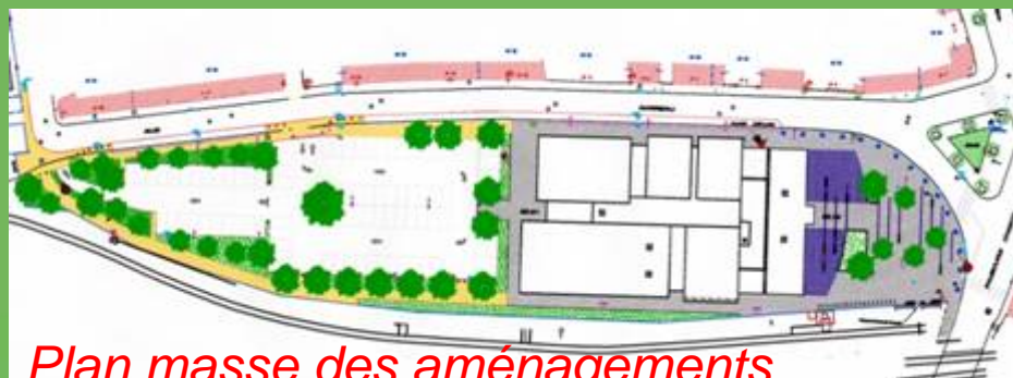
Plan masse des aménagements